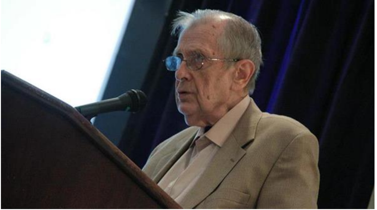
Profesör Stanley Krippner

Margeret da rüyalarında sık sık dev bir yılan tarafından derin bir gölün içine çekildiğini ve suyun altında da nefes alabildiğini farketdiğini anlattı. Kabile büyükleri, bu rüyaların büyük bir sembolizm taşıdığını, dev yılanın onun bilinçaltı korkularını ve derin gölün de gizemler dünyasını temsil ettiğini ve gölün içinde de nefes alabildiğine göre bu aleme artık ilk adımlarını atabileceğini söyleyip onu bir şaman olarak yetiştirmeye başladılar. Ancak o zamana kadar bir hristiyan olarak yetiştirilmiş olan Margeret için şamanlık fikrini benimsemek hiç te kolay görünmüyordu. Tabii ki Hz. İsa'nın da bir şifacı olduğunu ve bu yeteneğini sıkça kullandığını öğrenene kadar.